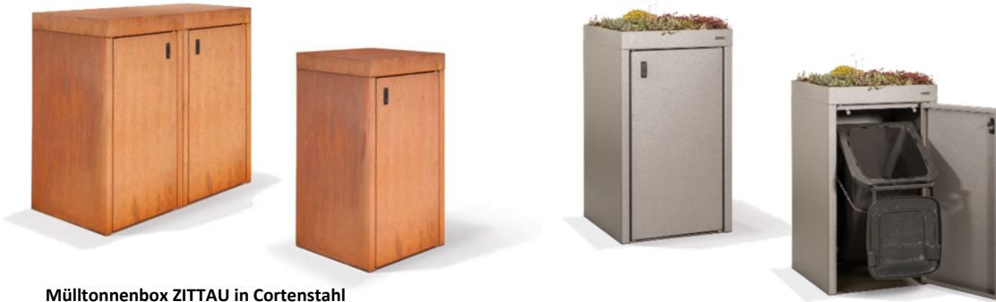
Mülltonnenbox ZITTAU in Cortenstahl für 120 l, 140 l und 240 l Mülltonnen