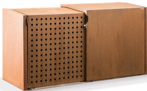
Mülltonnen- und Fahrradbox XANTEN mit 2 Schiebetüren