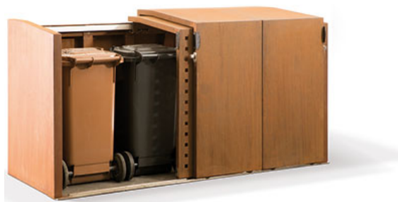
Mülltonnen- und Fahrradbox XANTEN mit 4 Schiebetüren – als Mülltonnenbox