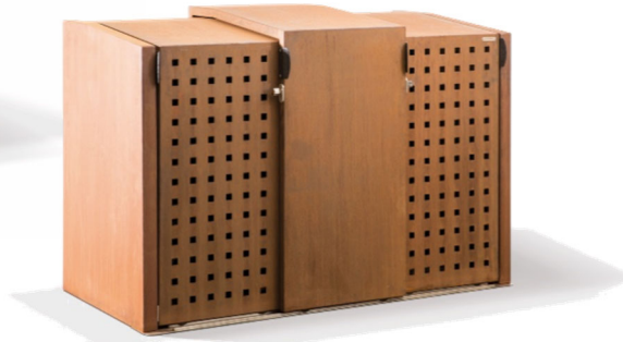
Mülltonnen- und Fahrradbox XANTEN mit 3 Schiebetüren